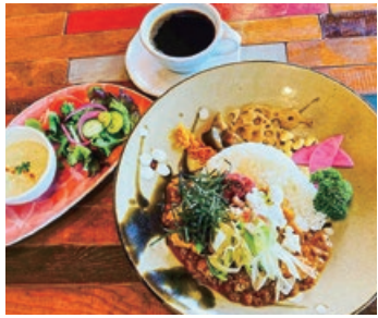
「ごまチキンと長ねぎ梅干しカレー」ランチセット 1,595円 期間限定メニューが人気のため定番に。ゴマで香ばしく焼いたチキンと、ネギ、南高梅、長芋、ミョウガをトッピング。

カレーの辛さは、辛さなし、小辛、中辛、辛口から選べる。通常は中辛で、激辛もオーダー可能。