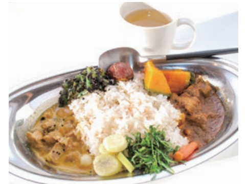
「2種盛りカレー」1,200円 ワインビネガルの酸味を効かせたポークビンダルーと、ココナッツミルクとレモンで仕上げたココナッツチキンカレー。単品は各1,100円。季節野菜の付け合わせも魅力的。プラス200円で、自家製ハーブティー(トゥルシティー)が付けられる。

空き家になった民家を、店主自ら改装した店舗。毎月第2・4木曜日は文化長屋磯蔵の「カレーの日」に提供しているそう。