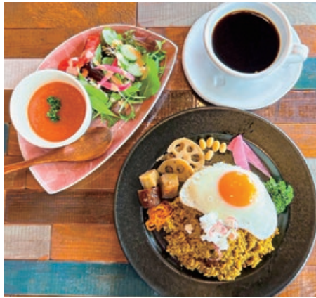
「チキンキーマ」ランチセット 1,485円 一番人気の鶏挽き肉のキーマカレー。ランチタイムのセットはサラダ、スープ、ドリンク付き。単品は1,210円。

無添加のスパイスカレーと和スイーツを堪能 化学調味料無添加のカレーは出汁とスパイスで作るオリジナル。トマトキーマ、チキンカレー、あさりカレーなど約10種に、チーズ、キノコなどトッピングもできる。旬の野菜は自家農園「シャムロックファーム」産のものを用い、店主の実家のあんこの味を再現した和スイーツも合わせて味わいたい。