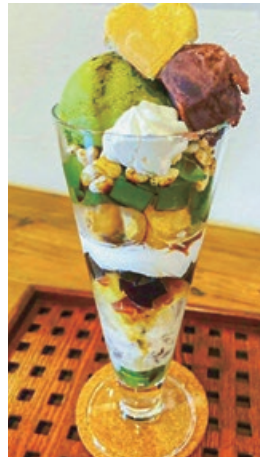
「抹茶パフェ」1,078円 自家製抹茶アイス、こしあん、わらび餅、コーヒーゼリー、あずきアイスなどてんこ盛りのパフェ。

「あんぱんトースト」572円 土浦市で昭和25年創業の「あんこや小野」(現在は閉店)のあんを再現した、こしあん粒あんを自家製パンのトーストで味わう魅惑の一品。