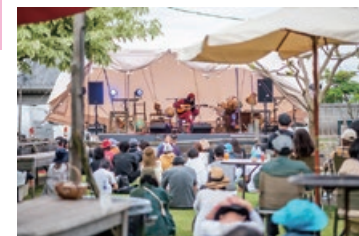
圖結いプロジェクト事務局 info@yuiproject.org http://www.yuinote.jp

4月22日(土)11:00～18:00、18:00～20:00、23日(日)11:00～18:00 ※雨天決行、荒天中止 結城市・結城市内各所(結城市民文化センターアクロス、奥順、孝顕寺ほか) 1DAY 4月22日(土)昼(ホール)、4月23日(日)昼(タウン)各8,000円ほか ※マーケットエリアはチケットなしで入場可能。