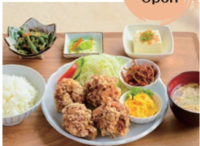
げんこつ唐揚げ定食 1,000円

お弁当屋創業当時の秘伝のレシピで作る唐揚げはげんこつ大のビッグサイズ。その唐揚げが4つものってガッツリ系男子も大満足のボリュームで、人気ナンバーワン！