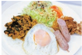
ガバオライス定食 1,200円 期間限定メニュー 人気のタイ料理を春夏冬亭風に。

できたてを食べてもらいたいというオーナーの長年の夢を実現し、定食屋として移転オープンさせた。定番と季節限定を合わせて30種類近くの定食メニューがあり、店名のように、何度足を運んでも「あきのこない、店づくりを心がけている。