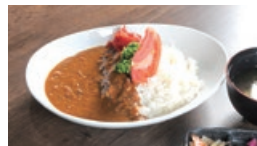
カレーライス定食 900円

見た目がインパクト大の厚切りとんかつ。実は、重さ330gの肉を長時間低温スチームで下処理してから揚けている。その手間を惜しまず調理しているからこそ外はサクッと中はジューシーに仕上がる。