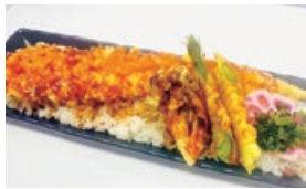
穴子一本天井 1,200円 期間限定メニュー