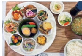
あきない御膳定食 1,200円