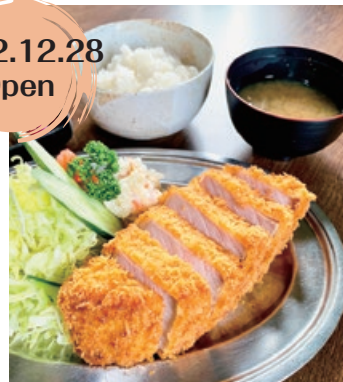
厚切りとんかつ定食 1,450円

見た目がインパクト大の厚切りとんかつ。実は、重さ330gの肉を長時間低温スチームで下処理してから揚けている。その手間を惜しまず調理しているからこそ外はサクッと中はジューシーに仕上がる。