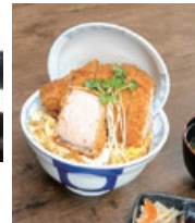
厚切りかつ丼定食 1,500円

肉を使わず野菜のみで煮込んで作った自慢のカレー。厚切りとんかつで作るかつ丼は蓋が閉まらないボリューム。