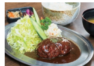
デミソ煮込み ハンバーグ定食 1,050円

常磐道土浦北インター近くの住宅街にあり、遠方からも食べにくるという。その目当ては厚さ4cmの「厚切りとんかつ」。運ばれてきた料理を見て思わず声が出てしまうほどのボリュームで、インスタ映えすると話題となった店の看板メニュー。