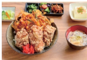
特製天から丼定食 800円