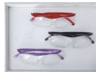
ハズキルーベは、サイズ2種類、拡大率3種類、色は豊富なバリエーションがあり、贈り物として人気かつ定番のひとつ品に。各10,980円。(メガネのクロサワ)