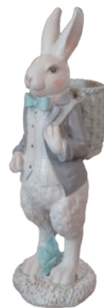
高さ約25cm。背負っているカゴにカギなどを入れてインテリアに。うさぎの小物入れ3,300円。植物生まれの、地球にやさしい森のふぎん。ムーミン柄スポンジワイプ各660円。(ログフォート)