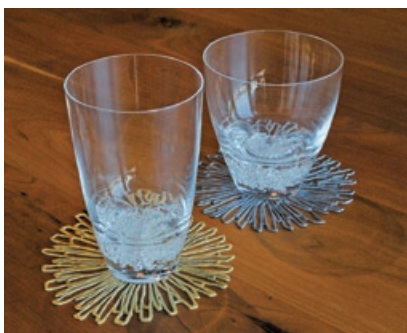
深海から沸き起こる力強い泡をイメージしたスガハラ「バブル」。(写真左) タンブラー5,500円。(写真右) オールド6,050円。チルウィッチコースター各550円 (ホームシック)