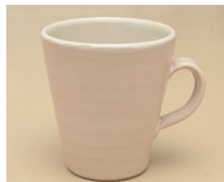
ほんのりとしたピンク色がかわいいマグカップ。毎日のティータイムを華やかにしてくれる。マグカップ 1,000円。(製陶ふくだ)