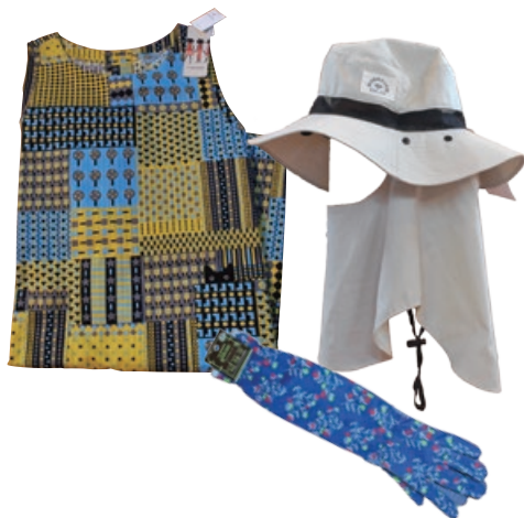
あらゆる世代に人気のマタノアツコ。エプロン6,930円。日差しが気になる季節、UVカット機能が活躍。お出かけやガーデニング、スポーツにもおすすめのフェイスガード付き日除け帽子2,200円、ガーデニンググローブ935円。(ログフォート)