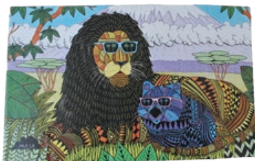
折りたためるからバッグの中でかさばらない、シンプルでスタイリッシュなメガネケース。オーストラリアのストリートアーティスト・モルガのイラストは、使わないときは飾っても素敵。MOLGA ホールディングケース1,650円。(メガネのクロサワ)