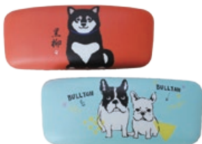
キャラクターが描かれた可愛らしいメガネケース。さまざまなタイプにフィットする大きめサイズで、お手頃価格なのもうれしい。各1,100円。(メガネのクロサワ)