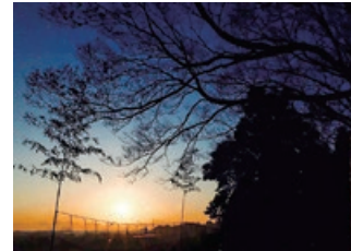
元旦には境内の「烈公御涼所」にて、初日の出を拝す「初日の出御来光清祓式」が行われる。