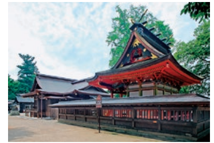
【御祭神】菅田別尊（ほんだわけのみこと）、息長足日売尊（おきながたらしひめのみこと）、姫大神（ひめのおおかみ） 【祈願】厄除、星除け、八方除け、諸難除け、家内安全、商売繁昌、成歳守護、亥歳守護、子育て守護、子授かり、安産、虫切り、身体健康

文祿元（1592）年、水戸城主・佐竹義宣公によって創建。徳川家の時代となった後も、水戸藩主代々の崇敬社として信仰された。国指定天然記念物の御葉付公孫樹などの文化財を有し、厄除、星除、八方除の開運守護の神社として、多くの参拝者が訪れる。 「はねつき神事」は羽根つきをしながらその年の稲の作柄を占う。