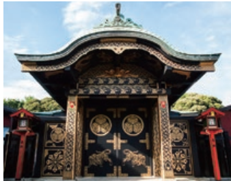
【御祭神】徳川家康公（東照公）（とくがわいえやすこう）、徳川頼房公（威公）（とくがわよりふさこう） 【祈願】家内安全、交通安全、初詣詣、入試合格、厄難消除、商売繁昌、七五三祭ほか

元和7（1621）年4月21日に、水戸初代藩主徳川頼房公が、父徳川家康公の御霊をこの地に祀ったのがはじまりである。 境内では、徳川斉昭公考案の日本最古の鉄製戦車と言われる、水戸指定文化財でもある「安神車」、頼房公奉納の「青銅燈籠」、朱舜水銘の「常葉山時鐘」などを見ることが出来る。