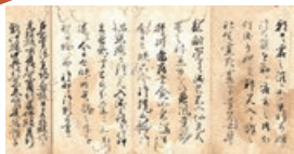
龍ヶ崎市・西光寺に残る古文書。「寿永元年」の文字が記されている。

800年続く米農家 米作りそのものだけでなく、 米作りとともにある文化を、伝え、繋げていく