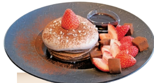
ココアパンケーキ 1,430円

フランボワーズやシャルトリューズ、トリュフなど、一粒一粒味わいも形も違う自家製チョコレートの詰め合わせ。まるで宝箱を開けたようなときめきを与えてくれる。(ルブラン)