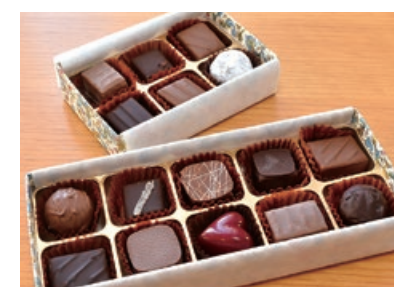
ボンボンショコラ 10個入り2700円 6個入り1690円、15個入り9970円

他店では味わえないオリジナルチョコレートがコレ。それぞれの豆の特徴を出すために、低温でじっくり焙煎。苦味を抑えながらも味わい深いカカオ75%に仕上げている。トゥマコ、シェラネバダの2種に加え、今年はアラウカのカカオが仲間入り。すっきりとしながら深みのある酸味が特徴。(ルブラン)