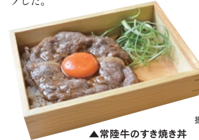
▲常陸牛のすき焼き丼 700円

提供スタイルに加え、素材もブラッシュアップ。ホタテと鶏のスープにトリュフを合わせるなど、新しい味わいを体験させてくれる。諭吉の代名詞とも言える人気メニュー“にぼとん”は、「特選つけそば」と名称を変え、さらに魚介感がアップした。