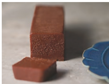
テリヌ・ショコラ 1500円

エクアドル産アリバカカオのショコラに、奥久慈卵とバターを加え低温でじっくり蒸し焼きにした、ねっとり濃厚なガトーショコラ。シンプルながら材料の質にとことんこだわったひと品。(シナリス)