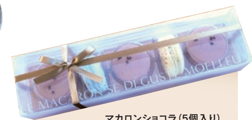
マカロンショコラ(5個入り) 1,280円

ココアパンケーキに濃厚チョコクリームとチョコソースをたっぷり。まわりにハート型のイチゴと生チョコを飾り、深作農園の甘いイチゴを心ゆくまで堪能できる。2月1日～14日限定。(ファームパティスリー ル・フカサク)