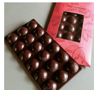
ビントウバーチョコレート 1300円

他店では味わえないオリジナルチョコレートがコレ。それぞれの豆の特徴を出すために、低温でじっくり焙煎。苦味を抑えながらも味わい深いカカオ75%に仕上げている。トゥマコ、シェラネバダの2種に加え、今年はアラウカのカカオが仲間入り。すっきりとしながら深みのある酸味が特徴。(ルブラン)