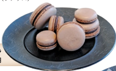
マカロンショコラ 1個330円

濃厚なチョコレートケーキ。エクアドル産ショコラとコロンビア産ショコラをブレンドし、芳醇でフローラルな香りを存分に楽しめる。気温の低いシーズンにしか登場しない季節限定のケーキで、贅沢な口溶けが堪能できる。(シナリス)