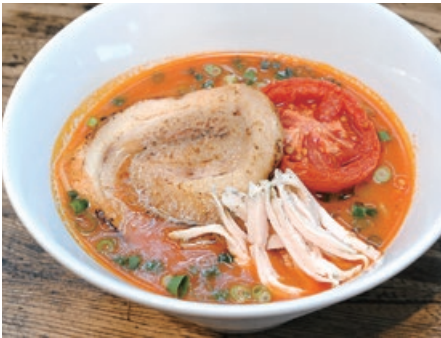
▲トマトラーメン 950円

トッピングにも一工夫。チャーシューの代わりにポルケッタは、数種類のハーブとニンニクなどで味付けし、低温でじっくり焼いたイタリア料理。