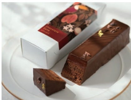
チョコレートケーキ プレミアム 2,808円

濃厚なチョコレートケーキ。エクアドル産ショコラとコロンビア産ショコラをブレンドし、芳醇でフローラルな香りを存分に楽しめる。気温の低いシーズンにしか登場しない季節限定のケーキで、贅沢な口溶けが堪能できる。(シナリス)