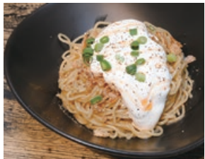
▲海老クリーム替え玉 420円

イタリアンシェフ歴20年以上になる店主が、これまでの経験から培ったトマトソースをベースにした、唯一無二のトマトラーメン。ニンニクオイルや唐辛子オイル、白ワインビネガーなど卓上の味変アイテムもイタリアンテイスト。