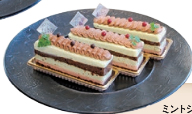
ミントショコラ 1個500円

ビターチョコレートをサンドした濃厚なマカロンと、もっちり濃厚なチョコレート生地にはスベアミントを煮出して作ったムースをサンドし、底にイチゴのチョコを敷いたバトンケーキ。どちらも2月1日～14日限定。(ファームパティスリー ル・フカサク)