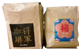
(写真左) 「將軍珈琲」 200g 1,800円

インドネシア産深煎りにエチオピアをブレンド。徳川慶喜公が欧米大使をもてなしたコーヒーを、文献を元に再現。