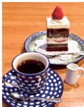
梅ブレンド 850円 チョコカステラショート 800円

県内11店舗、東京6店舗を展開するサザコーヒー。実際に農園を訪れて仕入れたシングルオリジンコーヒーをはじめ、季節のブレンド、コーヒーに合わせたスイーツ&食事など、全ては至高の一杯を味わうために情熱を傾けている。